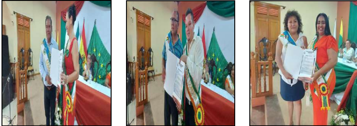
Declaratoria Huésped de Honor a autoridades municipales visitantes

4.13.1. Se concedieron 14 declaratorias “Huésped de Honor” a diversas autoridades que llegaron a la ciudad de Guayaramerín con un motivo oficial.