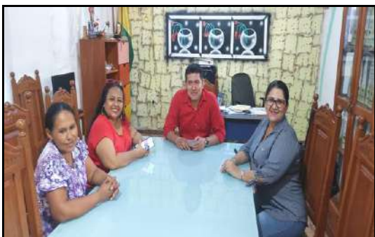
Trabajo de comisión en la Secretaría de Desarrollo Humano, apoyando a la Delegada Municipal de Villa Bella