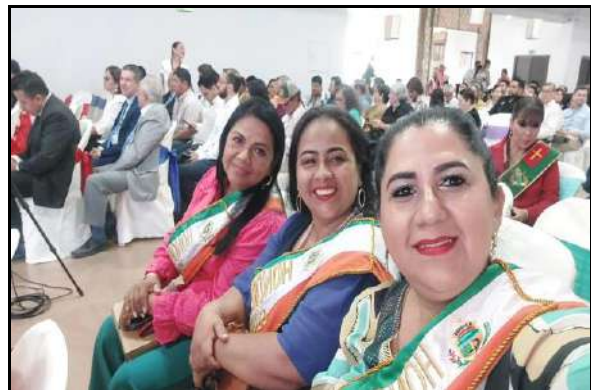
Participación en la Sesión de Honor en homenaje a los 337 años de fundación de la ciudad de la Santísima Trinidad (03/06/2023)