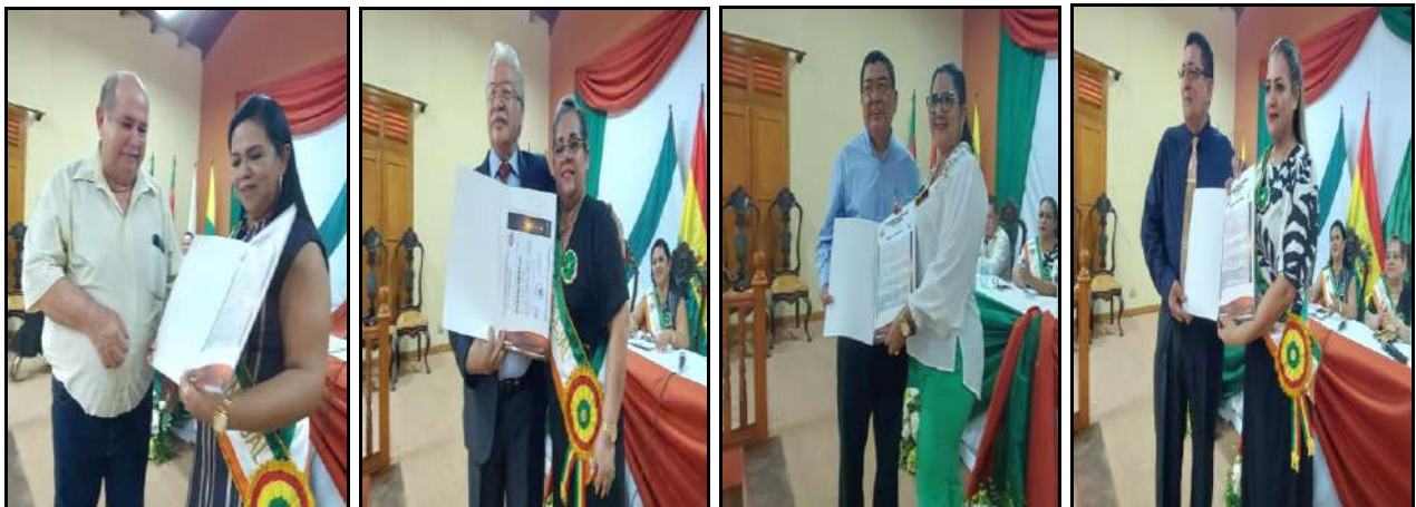
Reconocimiento al mérito y servicios destacados

4.13.1. En ocasión de la celebración del Día Cívico de Guayaramerín, en Solemne Sesión de Honor realizada en fecha 21 de septiembre de 2023, se entregaron reconocimientos a personalidades destacadas, por sus méritos y eminentes servicios prestados a la población en diferentes áreas del quehacer humano.