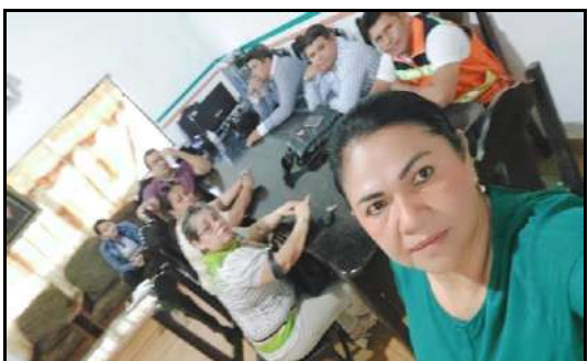
Trabajo de directiva y comisión en la Secretaría Técnica del G.A.M.G.