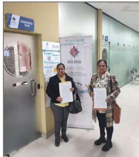
Presentación de denuncia al Viceministerio de Transparencia Institucional y Lucha Contra la Corrupción