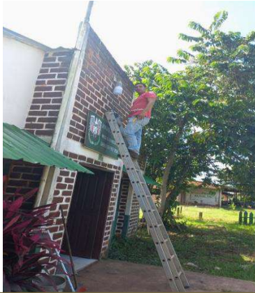
Inspección y posterior reparación de la instalación eléctrica y alumbrado del puesto policial de Rosario del Yata

Estas intervenciones se llevaron a cabo de forma periódica, con alrededor de 50 inspecciones oculares “in situ”, donde luego de la constatación en el mismo terreno, se accionaron las correspondientes representaciones oficiales ante el Órgano Ejecutivo Municipal o las instancias institucionales correspondientes.