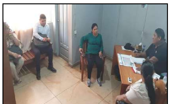
Trabajo de directiva y comisión en la Dirección del Hospital General Guayaramerín