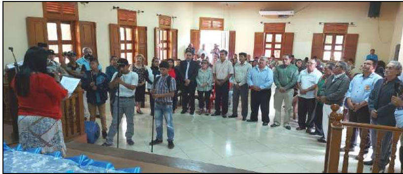
Posesión del Tribunal de Imprenta de Guayaramerín por la Presidente del H. Concejo Municipal

Dicho Tribunal se encuentra integrado por veinte ciudadanos notables de Guayaramerín, quienes tomaron posesión el pasado 10 de mayo, en solemne acto en homenaje al “Día del Periodista Boliviano”.