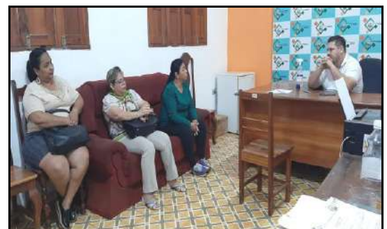
Trabajo de directiva y comisión en la Secretaría Municipal de Salud