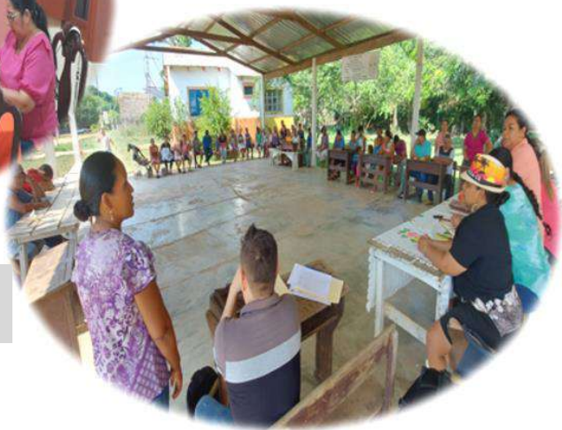
Sesión Ordinaria Ampliada en Villa Bella – Distrito Rural Nº 2

La proyección anual para la gestión 2023 fue de 117 Sesiones, entre Ordinarias, Ordinarias Ampliadas en Distrito Rural y Sesiones Extraordinarias; habiendo llevado a cabo un total de 113 Sesiones, lo que significa una ejecución del 97% de lo planificado.