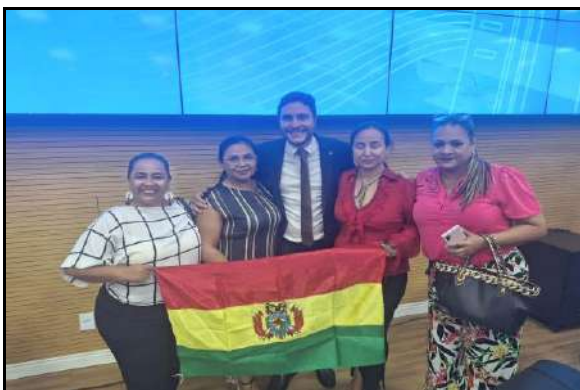
Participación en el Seminario sobre el Puente Binacional Guayaramerín (Bolivia) – Guaiará Mirim (Brasil) – 31/08/2023