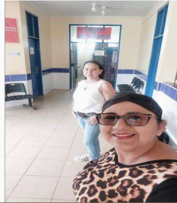
Inspección a la infraestructura física del Hospital General Guayaramerín “Dr. Luis Alberto Navarro Rodríguez”