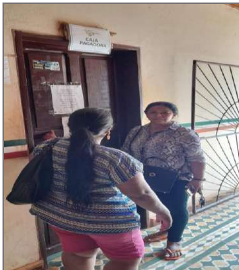
En el lugar del hecho, haciendo seguimiento a las investigaciones policiales