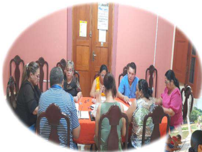
Sesión en la Sede del Concejo Municipal