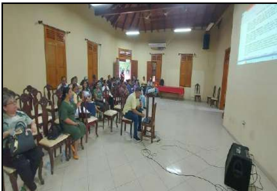
Socialización del Proyecto de Ley Municipal de Áridos y Agregados (07/06/2023)

Así también, un avance importante en este aspecto ha sido la aprobación y posterior promulgación de la nueva “LEY MUNICIPAL DE ÁRIDOS Y AGREGADOS” No. 0311/2023 de fecha 14 de agosto de 2023, la misma que tiene por objeto regular el manejo y aprovechamiento de áridos y agregados en toda la jurisdicción territorial del Municipio de Guayaramerín; correspondiendo al Órgano Ejecutivo Municipal regular el procedimiento operativo de ejecución de esta normativa, a través de su respectiva reglamentación.