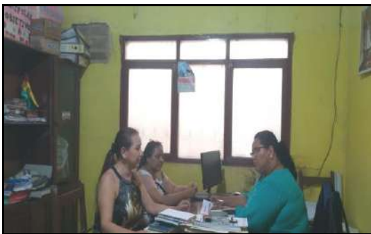
Trabajo de la Comisión Niña, Niño y Adolescente en la DNA del G.A.M.G. Caso Menor Abandonado