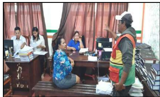
Trabajo de la Comisión de Educación en la Unidad Encargada de la Entrega del ACE