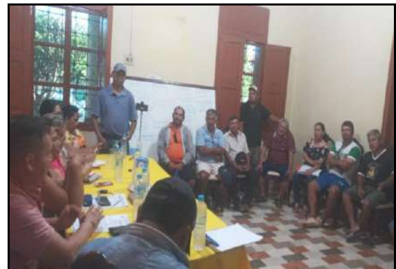
Reunión con explotadores y comercializadores de áridos y agregados (22/06/2023)